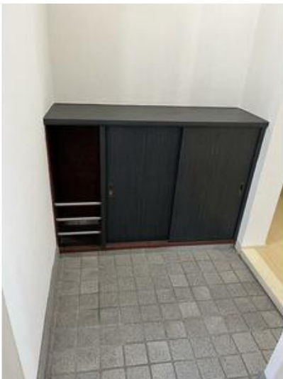
玄関シューズボックス