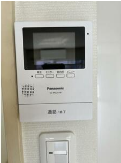
モニター付インターホン